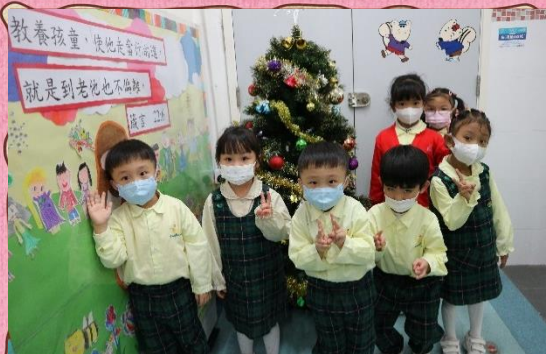
聖誕節到了，我們一起與聖誕樹合照！