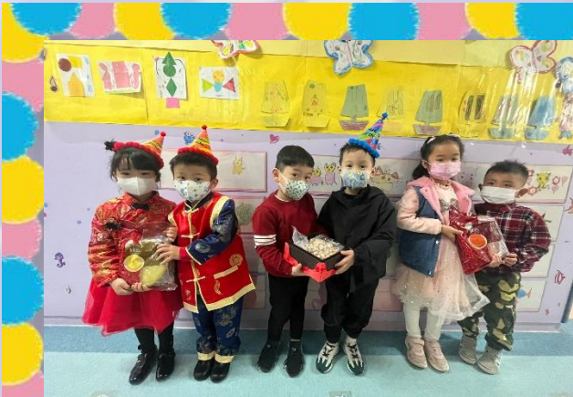
新年到了，我們認識了不同的賀年食物！