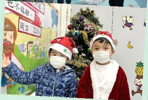
一起慶祝 主耶穌的生日吧！