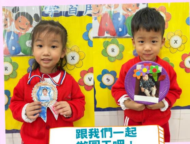
跟我們一起 做圖工吧！