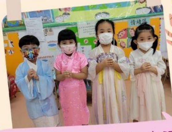
我們穿著傳統服飾，真漂亮！