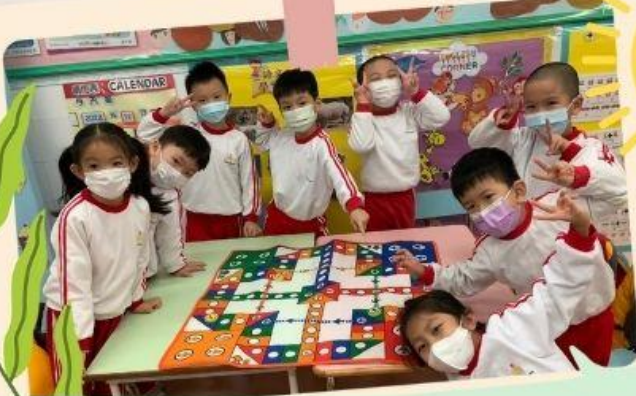
一起玩飛行棋真開心!