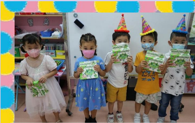
我們一起為生日之星慶祝生日！