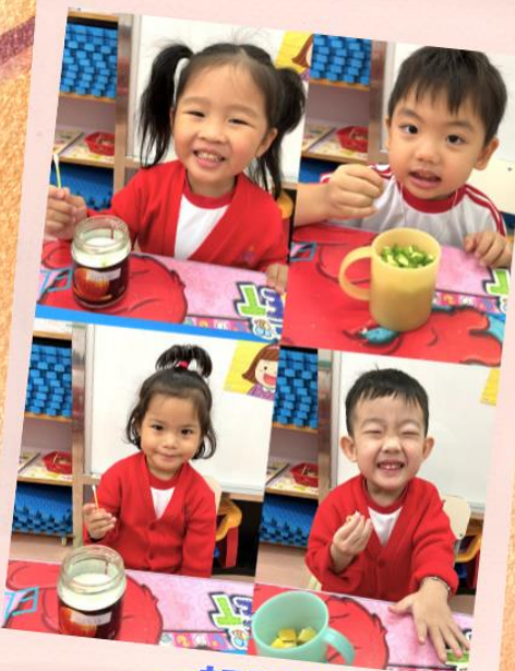
一起品嚐 不同的味道吧！