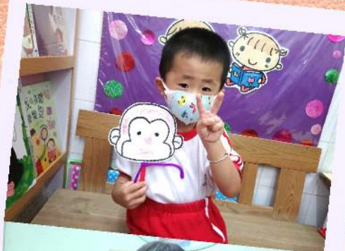
我們做的圖工好看嗎？