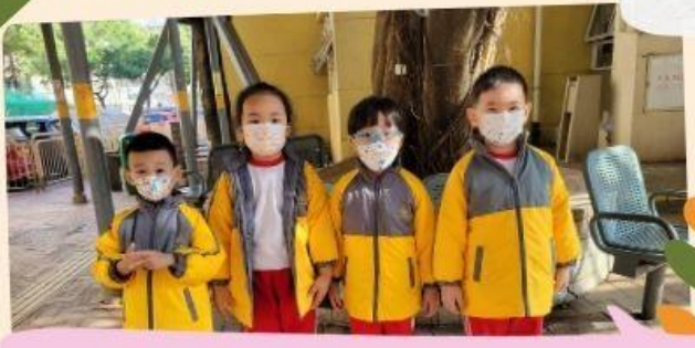
我們遊覽社區設施。