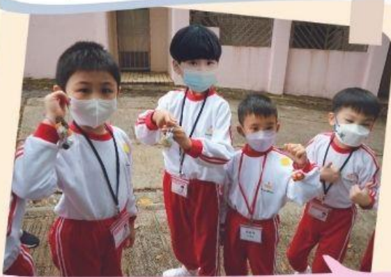
我們參觀可觀自然教育中心 一起製作香包，真好玩!