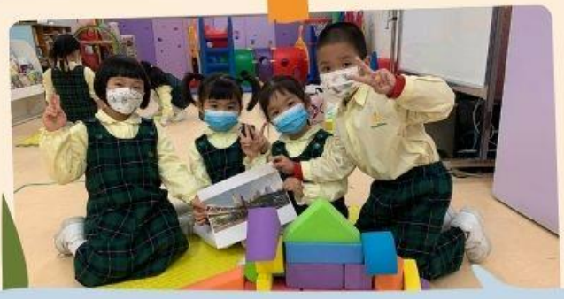
來看看我們在砌大橋！