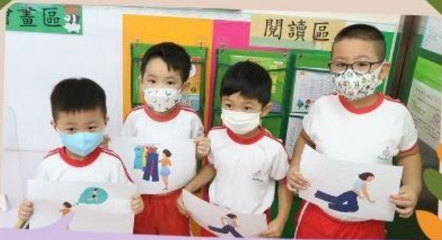
我們在進行故事創作。