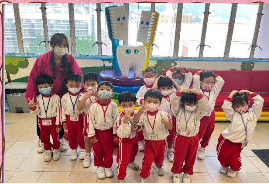
我們一起到陽光笑容小樂園參觀，真愉快！