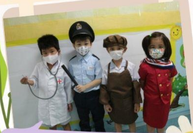
猜猜我在扮演甚麼職業?