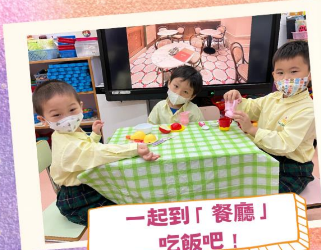
一起到「餐廳」 吃飯吧！