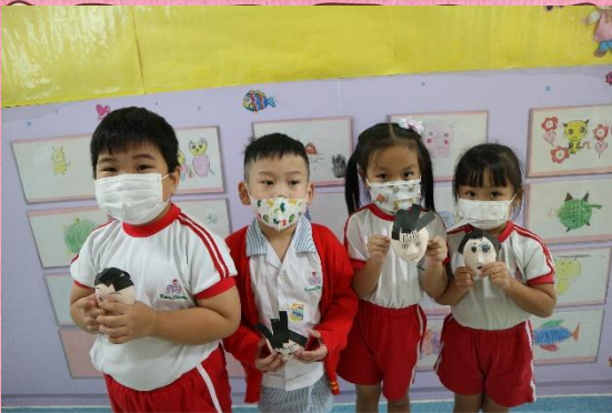
我們製作了人型臉譜的勞作！