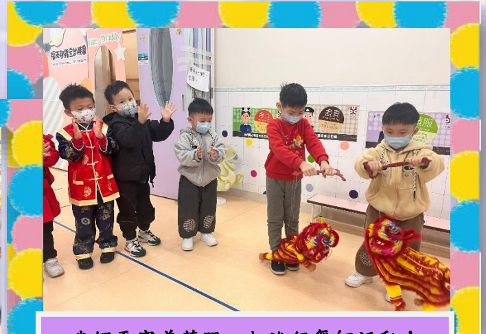
我們更穿着華服一起進行舞獅活動！