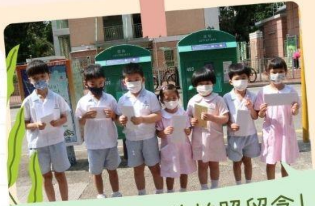
我們在郵箱前拍照留念!