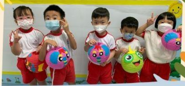
中秋節一起玩燈籠!