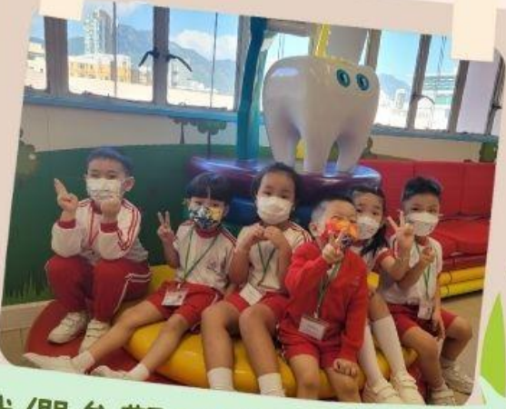
我們參觀陽光笑容小樂園。