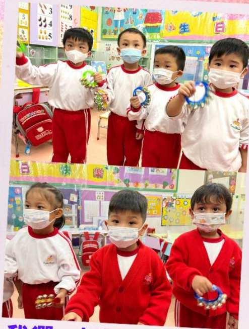
我們一起用馬鈴伴奏。