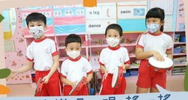
跟著音樂唱一唱，搖一搖，真動聽！