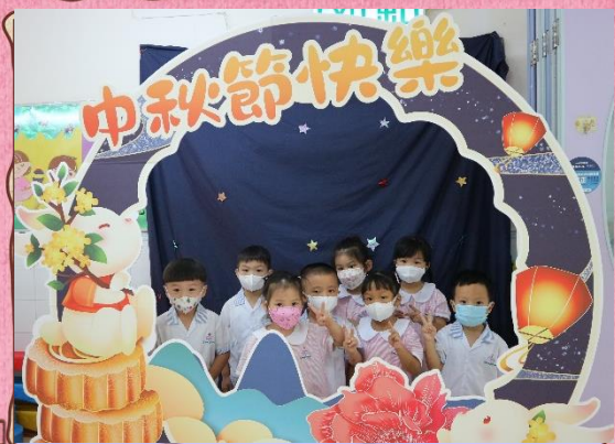
我們一起吃月餅慶祝中秋節！