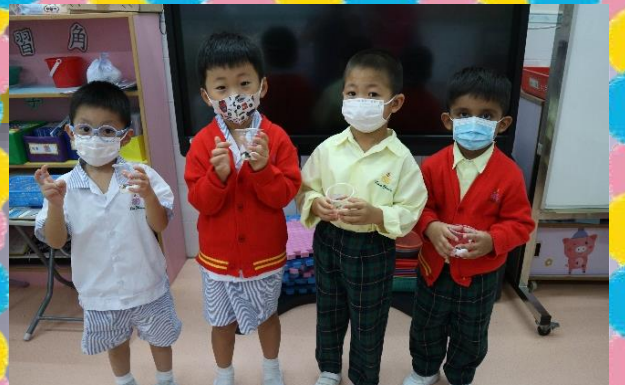
在「季節」的主題，我們用不同的豆來種植！