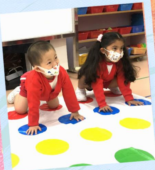
透過遊戲 學習不同的顏色！