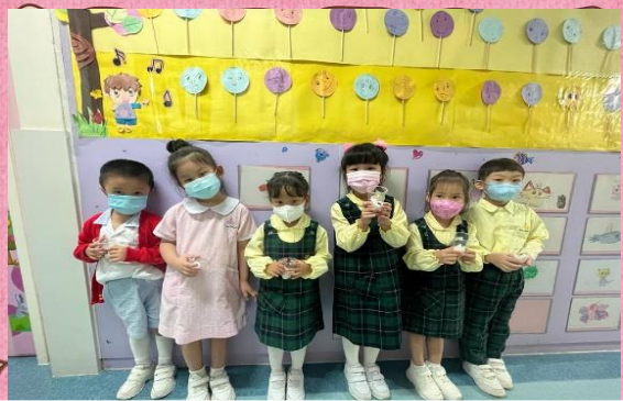
豆有不同種類！我們一起試試看用來種植吧！