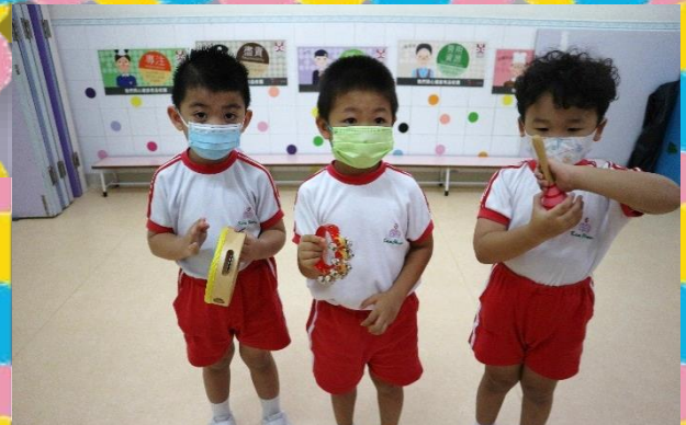
在音樂課堂時，我們用不同樂器大合奏！